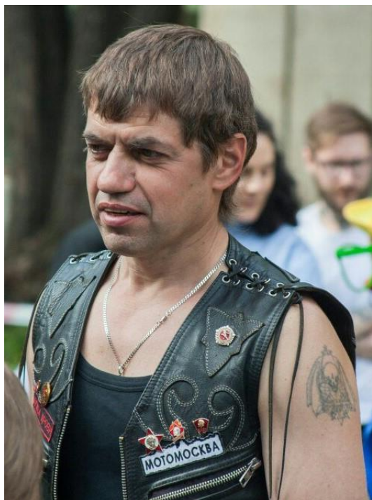
Пушили́н Серге́й Анато́льевич