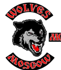
Мотоклуб Wolves MC