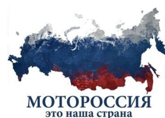
Сообщество «МотоРоссия» и «МотоМосква»